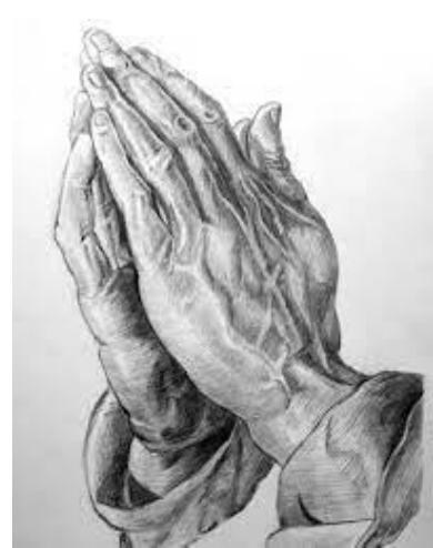
դ. Աղոթող ձեռքեր (մոտ. 1508)