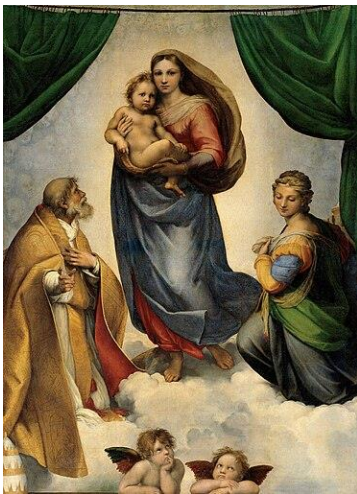
գ. Սիբստինյան Տիրամայրը (1512-1513) 1508)